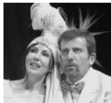
Sabrina Ferilli e Maurizio Micheli in La presidentessa

Ha da poco finito di girare La provinciale , una fiction di Pasquale Pozzessere, con Barbara Bouchet, Stefano Dionisi e Enzo De Caro, e appare con Diego