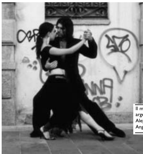
Il maestro argentino Alejandro Angelica

di sfruttare tutte le possibilità di movimento ed elasticità delle braccia e del tronco, in modo da non disperdere l'energia e di trasmetterla al partner; il secondo è quello più complesso, corrisponde alla capacità di adattamento, è influenzato dal nostro vissuto e dal nostro approccio con le persone, i segni si leggono nella postura e nelle tensioni