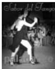
Sabor de Tango