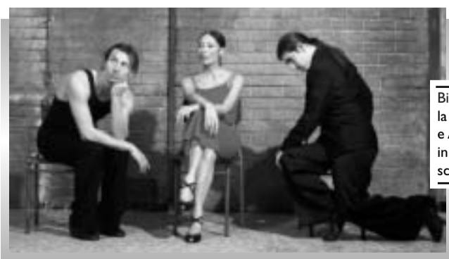
Bittante, la Savignano e Angelica in un'altra scena

poteva riportarne più intima definizione, riprendendo una famosa frase del cantante e poeta Enrique Santos Discepolo: «Un pensiero che triste che si balla».