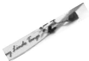
Muy Lindo Tango