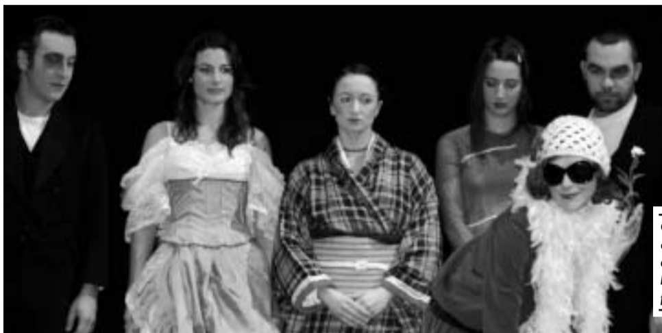
Gli interpreti di Babele, ovvero non lasciate che passi l'età

Il risultato è un interessante spettacolo, frutto non solo della creatività dell'autore, ma anche dell'attenta regia di