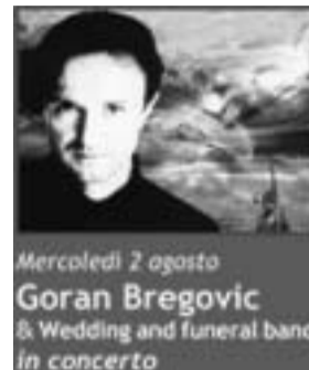
Mercoledì 2 agosto Goran Bregovic & Wedding and funeral band in concerto