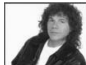
Domenica 13 agosto Riccardo Cocciantè in concerto