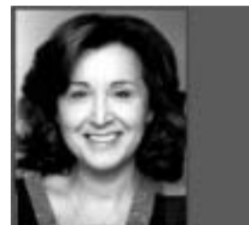
Giovedì 10 agosto La ragione degli altri di Luigi Pirandello con Paola Gassman regia Giovanni Anfuso