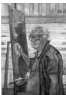
Nelle foto, da sinistra: Friedrich Dürrenmatt Selbstportrait , 1982 Die Kritiker , 1968

Dunque, di Romolo va colta l'ironia che, in ogni tempo e in ogni luogo, è la difesa più efficace contro la disperazione e il senso d'impotenza. Una satira al tempo stesso brillante, attuale e impietosa sul rapporto fra politica ed economia.