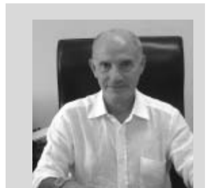
Mario Gattuso Preside della Facoltà di Scienze M.M.F.F.N.N.

«L'augurio è principalmente per l'università di Messina che, come università di tradizione, possa migliorare i suoi standard di qualità e non accusare eccessive difficoltà nella competizione con altre realtà che vivono in condizioni economiche più vantaggiose: i giovani che vengono da noi sono fortemente motivati ed il nostro impegno è quello di fornire servizi all'altezza delle aspettative».