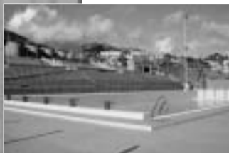
Il palazzo delle Poste e gli impianti sportivi dell'Annunziata sono due delle "sfide" che l'università affronterà nel 2007

cademico ci ha garantito la possibilità di avere una nuova sede che, però, è vincolata allo spostamento della facoltà di Giurisprudenza che attualmente ne occupa una parte. Anche se le prospettive sono buone, di fatto siamo ancora qui ed è difficile prevedere una data, è un processo a catena».